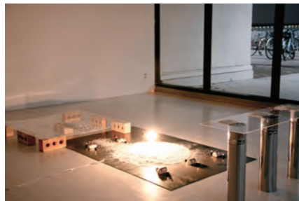
山越梓《無題》2011年 「すりぬけるもの」展 2011年12月12日～2011年12月16日、作品部分写真