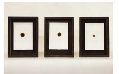
山越梓《焦点—痕跡》2012年